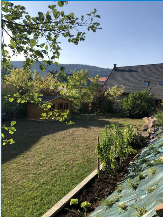
environnement arrière dégagé